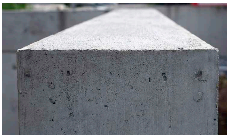
Scharfkantige und ebene Mauerkrone nach dem Ausschalen.