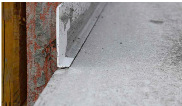
Das Winkelprofil ist an der Längsseite an die Schalung genagelt.