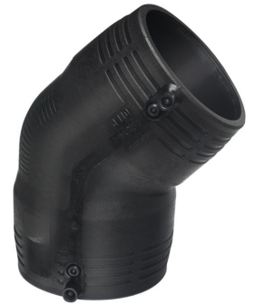
d 75 - 180