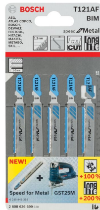
T 121 AF