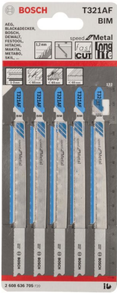
T 321 AF