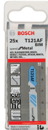
T 121 AF