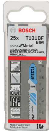
T 121 BF