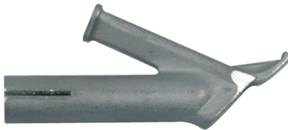
106.992 / 993